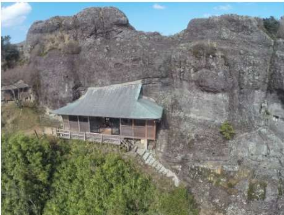
五辻不動尊 (国見町)